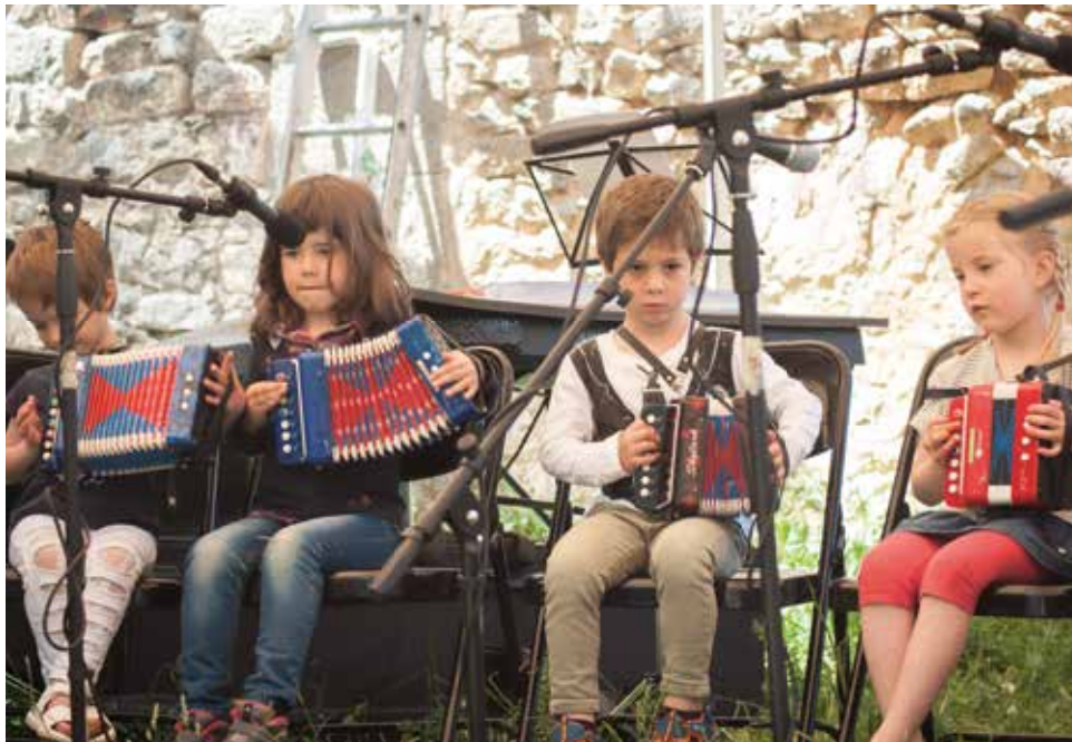
Com a part del programa Folk a l'Escola una vintena de professors van pels pobles de Berguedà, Cerdanya, Alt Urgell, Pallars Sobirà i Pallars Jussà a impartir classes extraescolars d'instruments i danses.

"Ha ajudat a teixir una xarxa de territori que no hi era. D'aquí han nascut noves amistats i també la creació de grups de música d'arrel tradicional: l'Orquestrina Trama, Sorguen, R.O.T., Stukat del Bolet...". En segon lloc, en el programa transversal i itinerant Folk a l'Escola, una vintena de professors es desplacen de dilluns a divendres en horari extraescolar als pobles de Berguedà, Cerdanya, Alt Urgell, Pallars Sobirà i Pallars Jussà a impartir classes d'instruments i danses. D'entre els 300 alumnes de totes les edats, cada any aproximadament la meitat són aprenents d'acordió diatònic. La Liv procura transmetre la mateixa passió que sent ella per l'acordió diatònic als seus alumnes, a banda de fer estimar la cultura tradicional. Peláez considera que "posem la música a l'abast de la gent que viu als pobles més desafavorits de muntanya, i la cultura els uneix