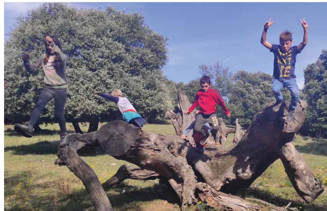
Alumnes de l'escola de Lliurona (Alt Empordà).

En definitiva, les escoles rurals són espais amb una clara funció social. L'alumnat, el professorat i les famílies teixeixen lligams amb el territori on es troben, ahora que donen vida als municipis petits. Més enllà de les peculiaritats de cada centre, crec que podem dir que educació, cultura i natura són un trinomi indissociable que les vertebrava.