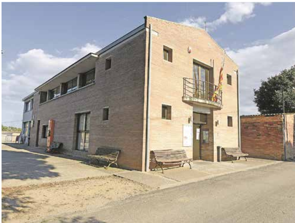
Després de romandre 50 anys tancada, l'escola de Palau de Santa Eulàlia (Alt Empordà) ha tornat a obrir portes aquest curs 2021-2022. És una prova pilot del Departament d'Educació.

berta i la vivència de la natura són un art més d'aquesta pedagogia, en aquest cas en una ubicació privilegiada, a prop del Parc Natural del Montnegre i la serra del Corredor. La mestra ressalta que l'inconvenient principal és la distància de l'escola respecte a les llars de moltes famílies que volen escolaritzar els seus fills d'acord amb aquesta pedagogia, mentre que els avantatges de l'entorn rural són gaudir de la natura, la tranquil·litat i la vivència de l'entorn. "Tot aquests aspectes magnífics hi són i et fan continuar."